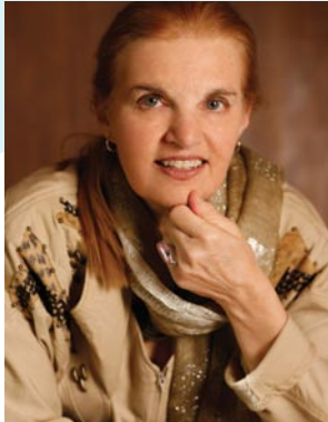
Мэрилин Аткинсон Президент Международного Эриксоновского Университета

НАША МИССИЯ: ТРАНСФОРМИРУЕМ МИР С КАЖДЫМ ДИАЛОГОМ! CHANGING THE WORLD ONE CONVERSATION AT A TIME!